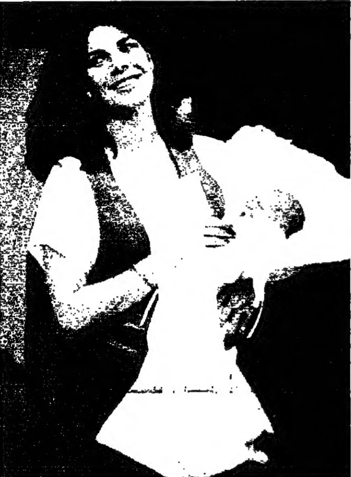
■ في حزيران الماضي وضعت الاميرة كارولين دو موناكو طفلا سمته اندريا البير، من زوجها الثاني الايطالي ستيفانو كازيرافي